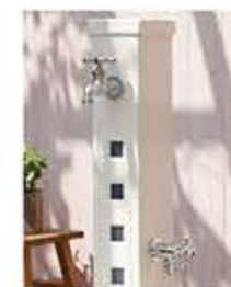
アーバンII(2口タイプ)