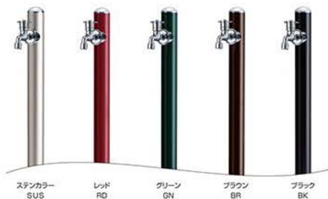
ステンカラー SUS レッド RD グリーン GN ブラウン BR ブラック BK