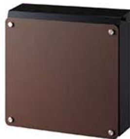
本体:ブラック パネル:錆茶