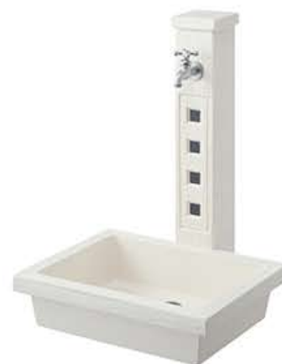
アーバンII(1口タイプ) トレビアーバン ガーデンパン