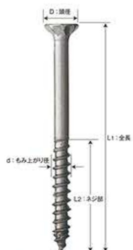
※この写真は生地色です。