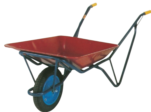
石材用強化一輪車