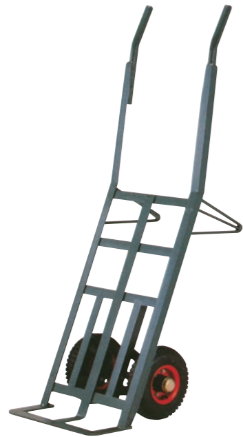
スチール製丁稚二輪車