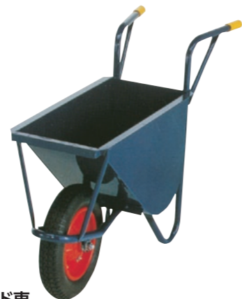
スリム2オカード車