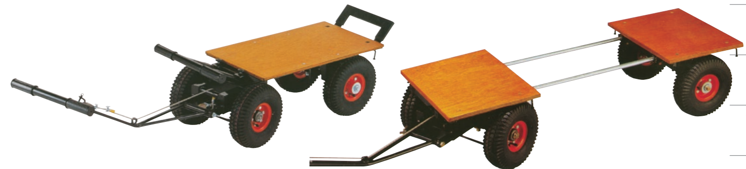
万能小型馬力車S型