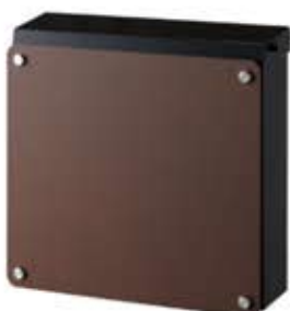
本体:ブラック パネル:錆茶