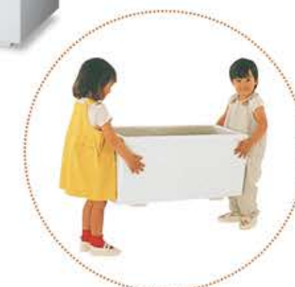
簡単に持ち運べる軽量プランター