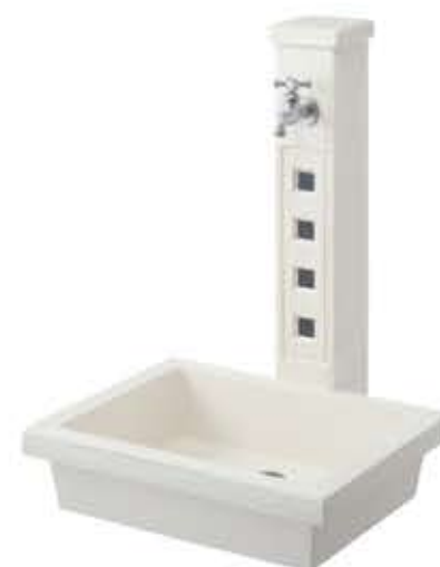
アーバンII(1口タイプ) トレビアーバン ガーデンパン