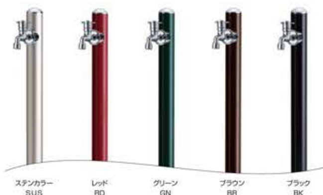
ステンカラー SUS レッド RD グリーン GN ブラウン BR ブラック BK