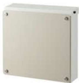
本体:ホワイト パネル:オフホワイト