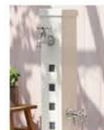
アーバンII(2口タイプ)