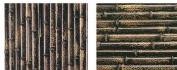
くろちくはんわり 黒竹半割 タテ貼・ヨコ貼