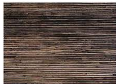
がましんまるいととおしかきしぶこしよくめり 蒲芯丸(糸通し)柿渋古色塗