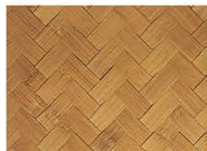
やきだけあじろ 焼竹網代