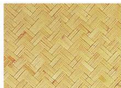
とくじょうよしあじろひとつはんつひ 特上霞網代(一ツ半飛)