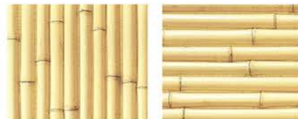
さらしだけはんわり 晒竹半割 タテ貼・ヨコ貼

サイズ・カラーに多少の誤差がありますので、あらかじめご了承ください。 表示価格に消費税は含まれておりません。 表示されている価格は商品のみ価格です。施工費は含まれておりません。