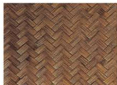
きょうちやっけあじろ 京茶竹網代