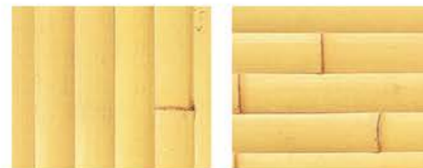
さらしだけひらわり 晒竹平割 タテ貼・ヨコ貼

青色表記の価格は、通常価格(黒色)と、価格体系が異なります。 詳細につきましては、お問い合わせください。