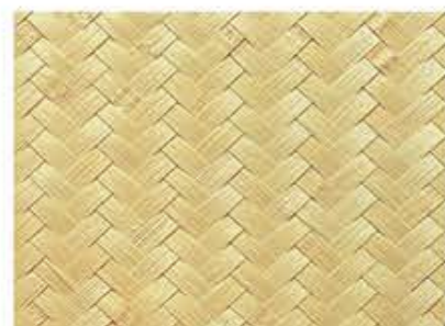
たけしろあじろ 竹白身網代(表面ウレタン塗装仕上)