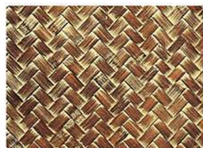
そめだけあじろ 染竹網代(トノコ入)