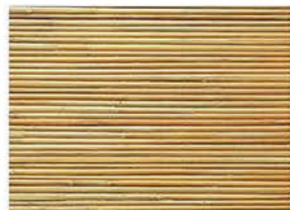
がましはんわり 蒲芯半割(ナイロン糸編)防虫品