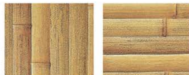
さびだけひらわり 錆竹平割 タテ貼・ヨコ貼