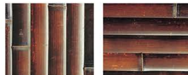
そめすだけひらわり 染煤竹平割 タテ貼・ヨコ貼