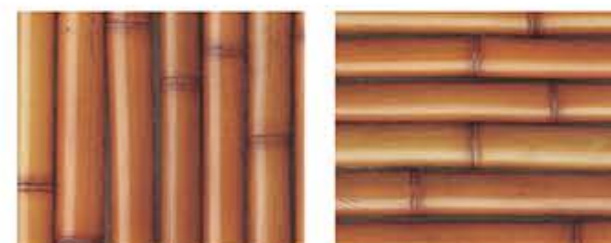
そめすこしよくだけはんわり 染煤古色竹半割 タテ貼・ヨコ貼