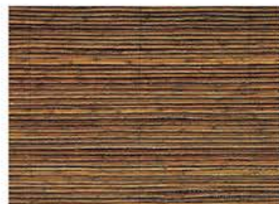
ほざはんわり 萩半割