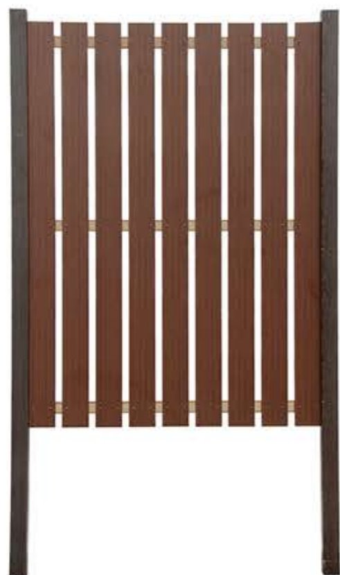
【写真例】スーパーファインボード(黒膚)H1800×W1470 柱・75角・古墨 基本1セット