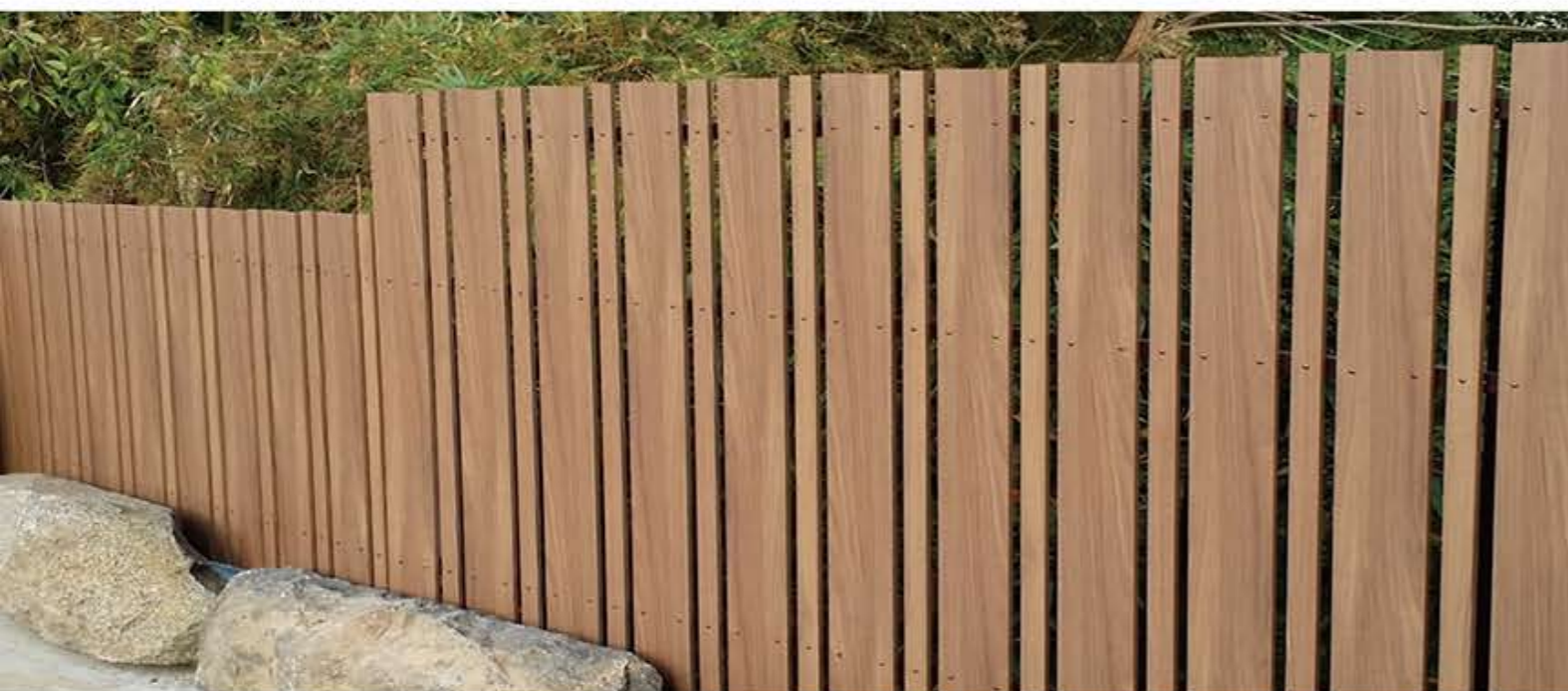
スーパーファインボード(京唐茶)