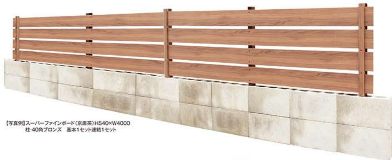
【写真例】スーパーファインボード(京唐茶)H540×W4000 柱・40角ブロンズ 基本1セット連結1セット