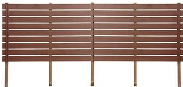
【写真例】スーパーファインボード(黒膚)H1240×W4000 柱・60角ブロンズ 基本1セット、連結1セット