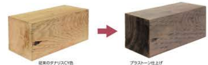
従来のタナリスCY色