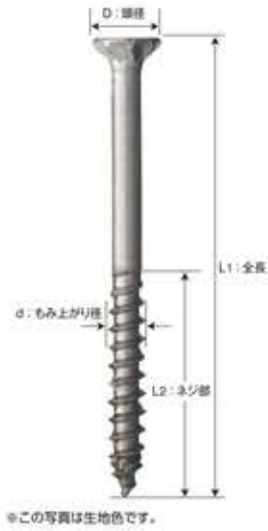
※この写真は生地色です。