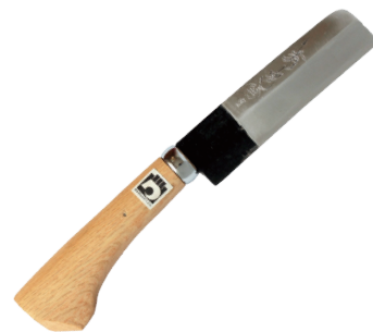
HO-107 竹割包丁(口金一体型) 刃長90mm