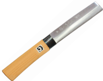
HO-102 竹割包丁(長) 刃長165mm