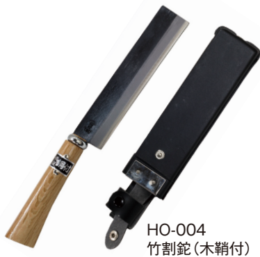
HO-004 竹割鉈(木鞘付) 刃長180mm/全長335mm