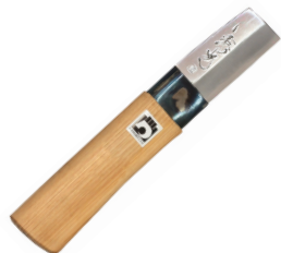
HO-101 竹割包丁(短) 刃長60mm