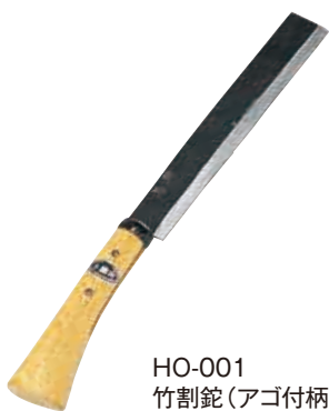
HO-001 竹割鉈(アゴ付柄) 刃長210mm/全長400mm