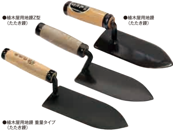
●植木屋用地鍬Z型 (たたき鍬)