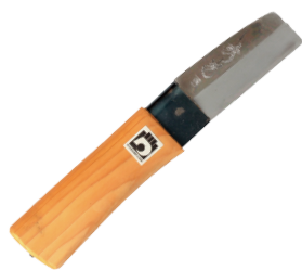
HO-105 竹割包丁(傾斜型) 刃長70mm