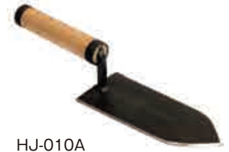
HJ-010A 刀匠 たたき鍬(白)