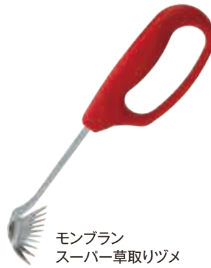
モンブラン スーパー草取りヅメ