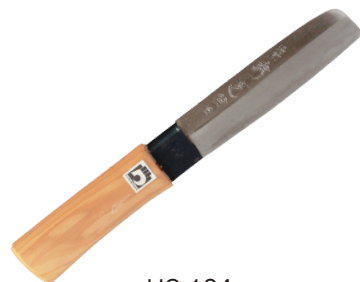
HO-104 竹割包丁(腹盛型) 刃長150mm