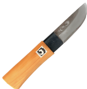
HO-106 竹割包丁(剣先型) 刃長90mm