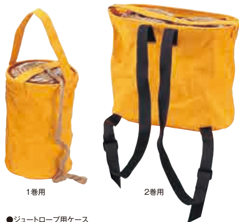
●ジュートロープ用ケース