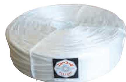
●ニューコード(結束用)

特長 PP製 数本のテープを熱溶着して1本にした紐です。伸びにくく、切り口がバラつかず、濡れても強度が変わりません。一般包装、荷造り、結束、陶器類の結束、植木の誘引等に。