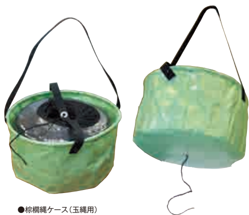
●棕縄ケース(玉縄用)