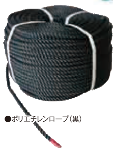
●ポリエチレンロープ(黒)