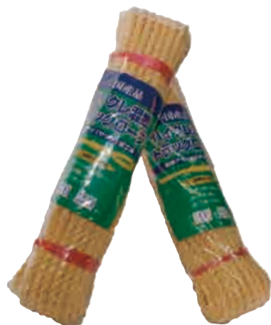
●ハイクレ混撚トラックロープ