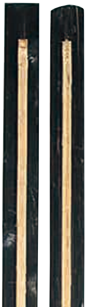
(材質・スギ、ヒノキ)