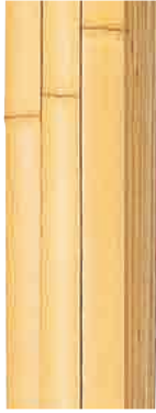
白建仁寺竹(孟宗竹)一等品