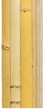
白建仁寺竹(孟宗竹)二等品