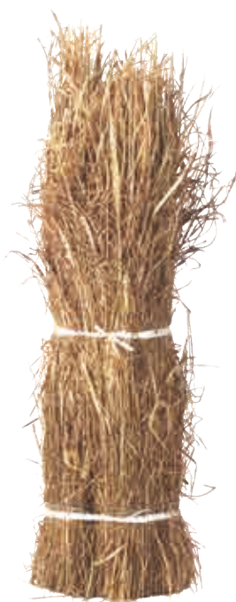
じゃりがや じゃり茅