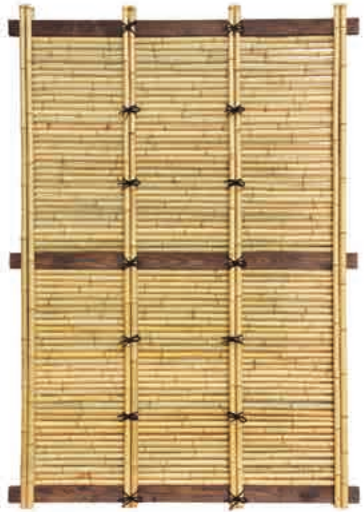
※飾り縄は、人工棕櫚縄です。