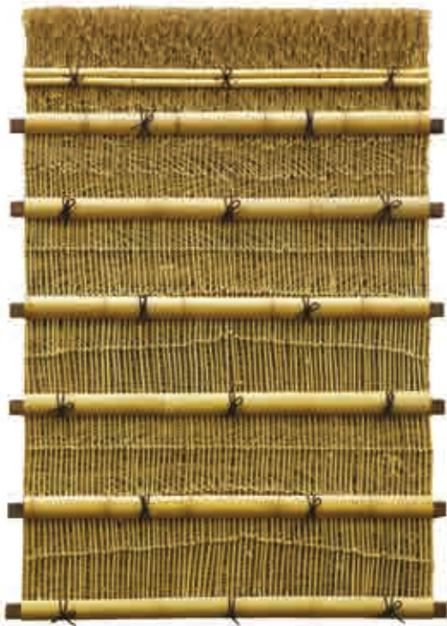
※飾り縄は、人工棕櫚縄です。